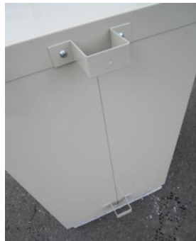
立て看板取付金具