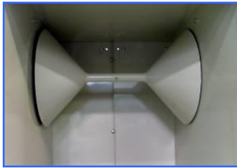
ごみネット巻取ドラム