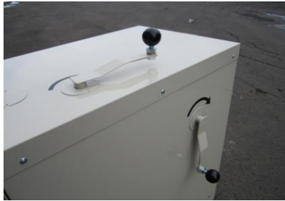
ごみネット、サークルネット巻取ハンドル