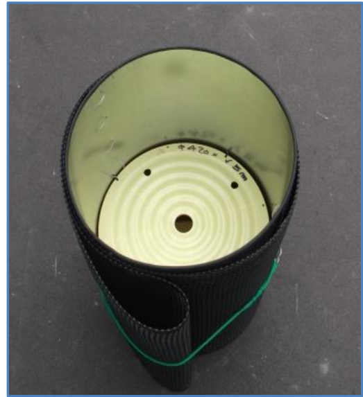
ごみステーション本体